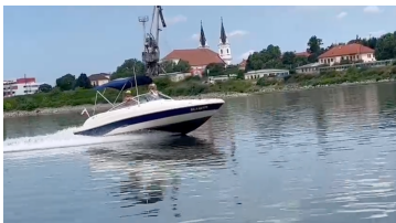
All In One Party

Plavba rýchlym člnom cez plavebnú komoru v Gabčíkove. Budete očarený výhľadom na Vtáčí ostrov, adrenalín rozprúdi krv pri preplavbe plavebnou komorou, budete obdivovať krásy prírody popri toku Dunaja a nakoniec zakotvíme na pauzu na sútoku Váhu a Dunaja v Komárne, kde budeme grilovať, kúpať sa a zabávať sa.