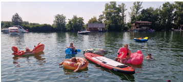
Grill & Party