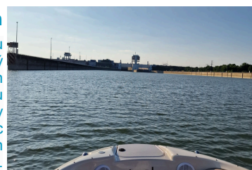
Adventure & Experience

Rýchlym člnom cez plavebnú komoru v Gabčíkove. Budete očarený výhľadom na Vtáčí ostrov, adrenalín rozprúdi krv pri preplavbe plavebnou komorou, budete obdivovať krásy prírody popri toku Dunaja a nakoniec zakotvíme na krátku pauzu v starom toku Dunaja kde sa občerstvíte.